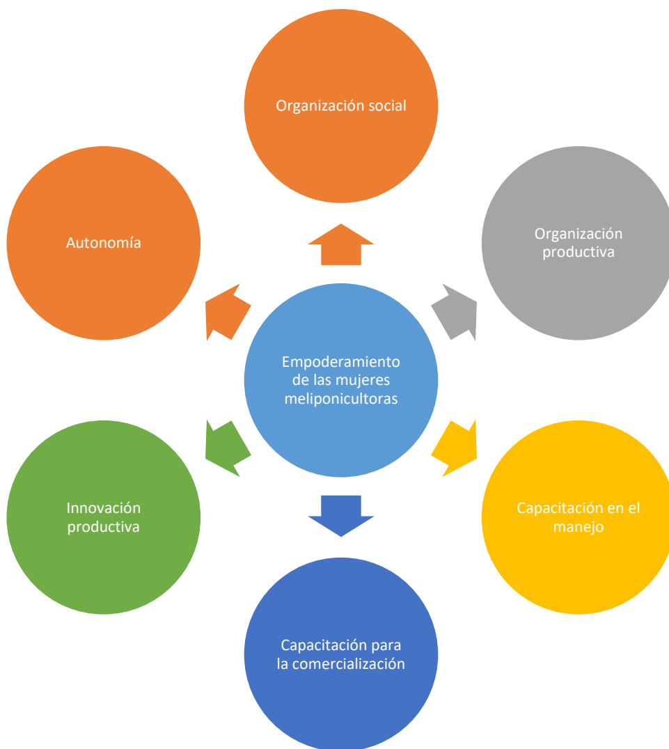
Figura 2. Factores que promueven el empoderamiento de las mujeres meliponicultoras.

En la figura 2 pueden observarse los factores que fueron identificados.