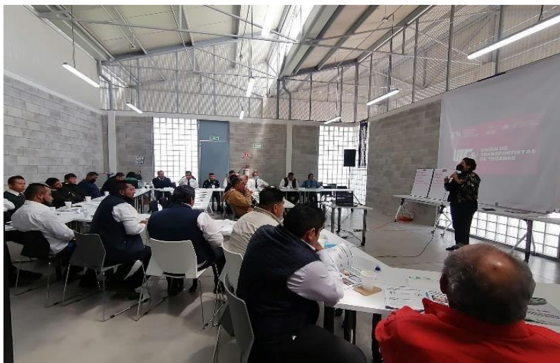
Primera capacitación a transportista del Estado de México, CICYT UAM-Tecámac, realizado en las instalaciones del CICYT Tecámac, Estado de México