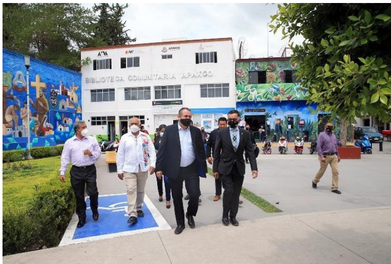
Firma de convenio CICyT UAM-Apaxco, realizado en el Municipio de Apaxco, Estado de México