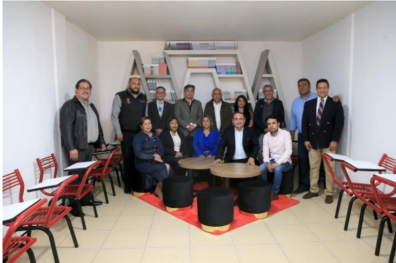
Instalaciones del CICYT UAM-Tequixquiac, evento realizado en el Municipio de Tequixquiac, Estado de México