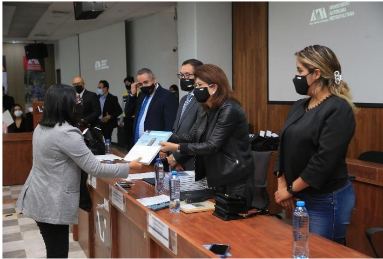
Firma de convenio CICyT UAM-Tecámac, realizado en Rectoría General