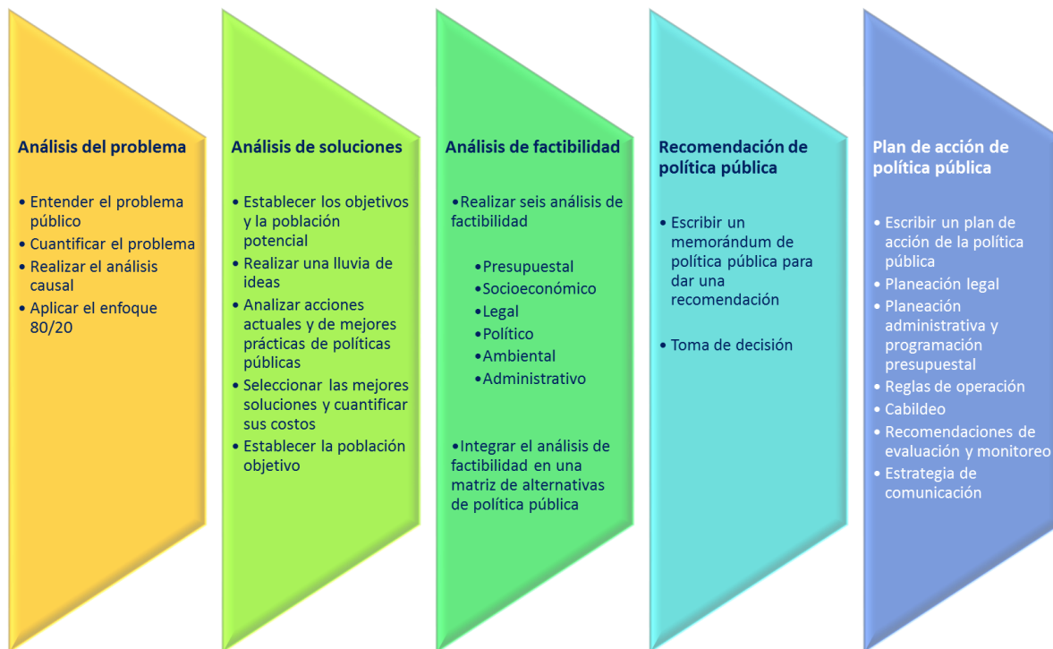
Figura 3. Cinco etapas para el diseño de políticas públicas viables. Franco (2012, p. 127)

La figura 3 presenta las cinco etapas para el diseño de políticas públicas viables.