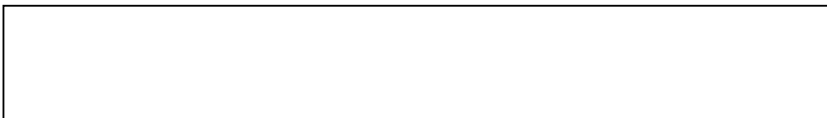
Figura 1.1 Cambio organizacional

La importancia del análisis de enfoque accional al análisis de las organizaciones, considera seis áreas interrelacionadas para el cambio organizacional.