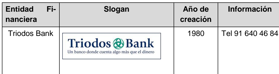
Tabla 2. Triodos Bank (Elaboración a partir de información presenta en la página web oficial de Triodos Bank https://www.triodos.es/es/particulares Revisado el 15/05202019).

Triodos Bank es una institución financiera europea independiente y sostenible creada en 1980, que se creó con la finalidad de hacer una banca para promover un impacto social positivo. Para lograr este meta, Triodos Bank opera con cuatro valores corporativos utilizados como objetivos a la hora de operar como entidad financiera (Martínez, 2017).