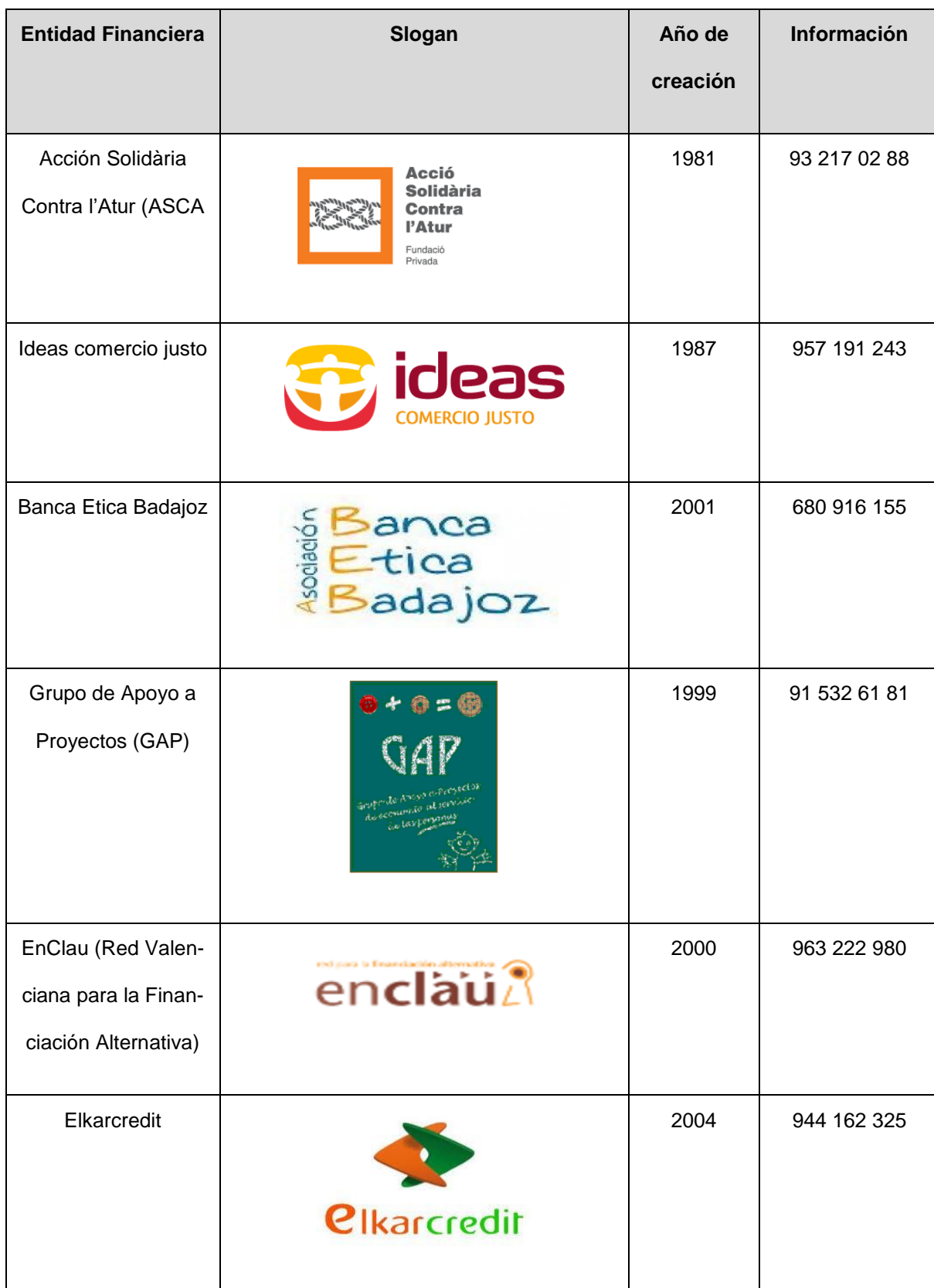
Tabla 4. Instituciones financieras éticas (Castro, M. y Romero en Martínez, 2017).