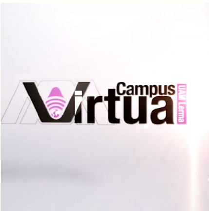
Nota. [Imagen del Logo de Campus Virtual]. Recuperado de http://campus-virtual.ler.uam.mx:18080/CampusVirtual/CampusVirtual/login_formaRegistro.action..

Con base en las categorías de análisis (componentes de las capacidades de adaptación), se obtuvieron los siguientes resultados preliminares: