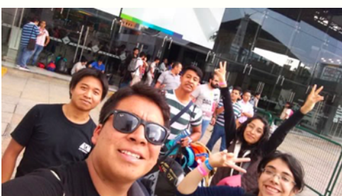
Nota. [Fotografía de alumnos de la Licenciatura en Computación y Telecomunicaciones].